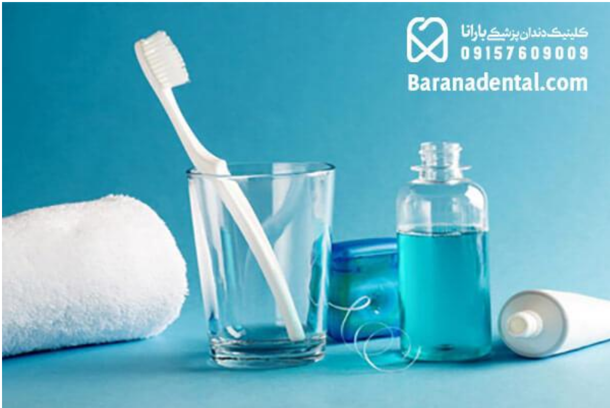
دهان شویه و نخ دندان برای مراقبت از دندان عصب کشی شده