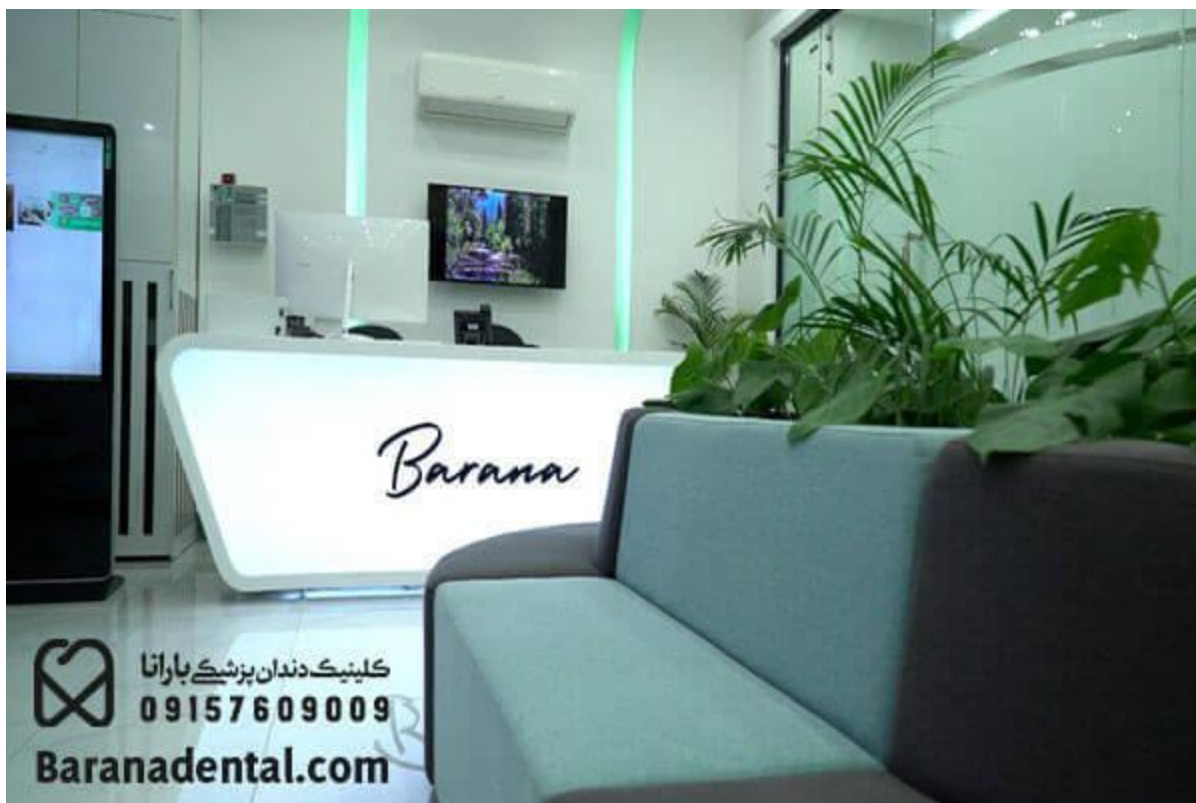
کلینیک دندان پزشکی بارانا در مشهد