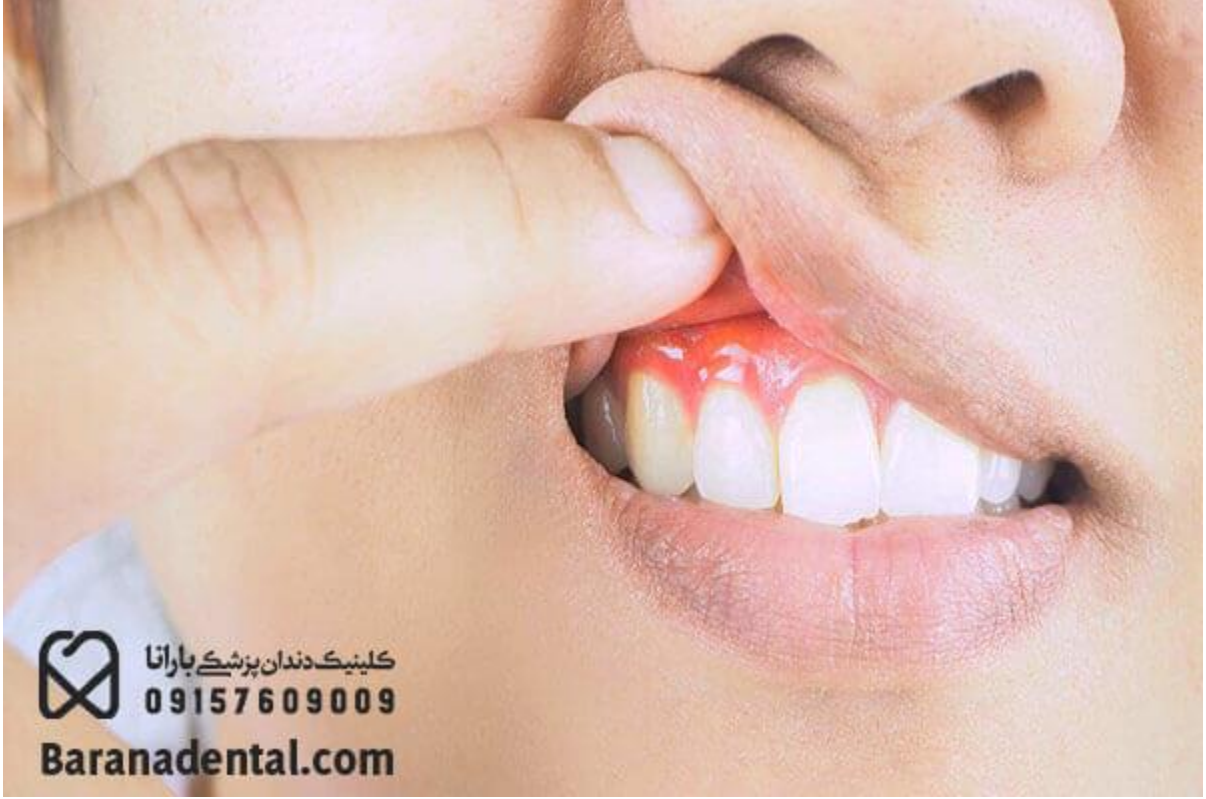
جوش لثة دندان عفونی

عادة ما يسبب الفك ظهور بثور على اللثة بسبب التهاب جذر الأسنان. تسبب هذه البثور تورم واحمرار في قسم من اللثة. في بعض الأحيان تخرج الالتهابات من قسم البثور على اللثة، وفي بعض الحالات لا يخرج القيح من محل الخراج؛ نتيجة لذلك يعاني الفك من ألم و تورم شديدين.