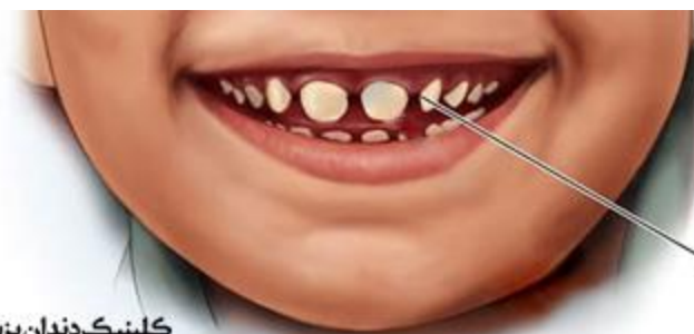
شکاف بین دندان