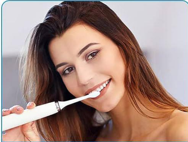
2. لاک را از قسمت پایین بچرخانید تا زل بیرون آید