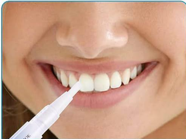
3. سطح تمام دندان ها را به مدت 30 دقیقه به زل آغشته کنید