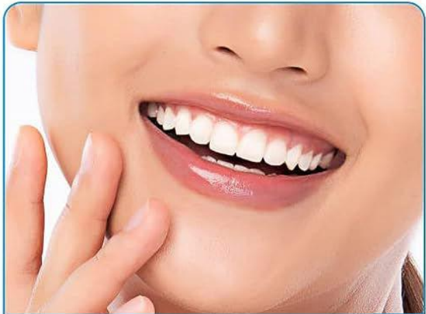
4. دندان های خود را بشویید