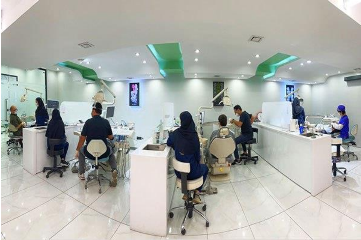
کلینیک دندانپزشکی بارانا در یک قاب