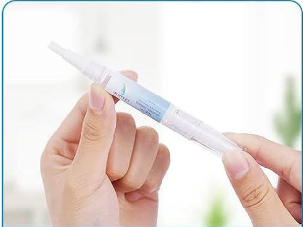
1. دندان های خود را مسواک بزنید