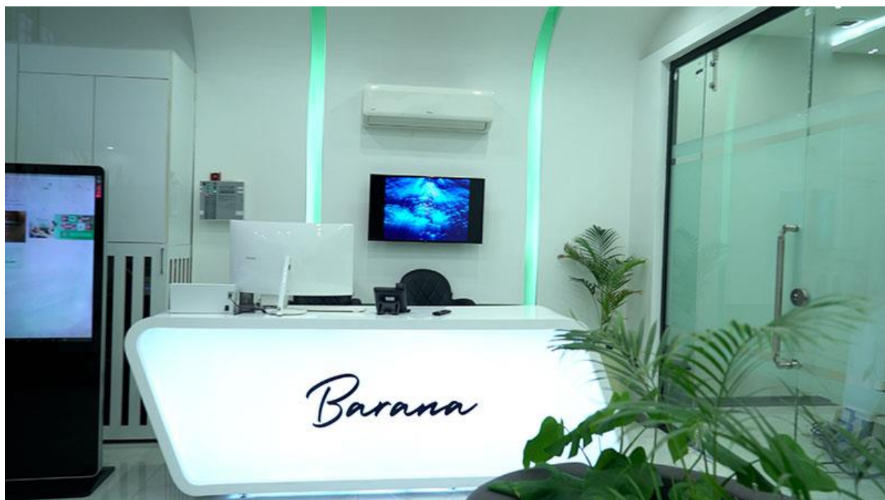
مرکز تخصصی دندانپزشکی بارانا در مشهد

اگر می‌خواهید کامپوزیت کنید اما اطلاعات زیادی راجع به این طرح درمانی ندارید، از طریق تماس گرفته و از شماره‌های ۰۹۱۵۷۶۰۹۰۰۹ یا ۰۵۱۳۷۶۰۹۰۰۹ با کلینیک دندانپزشکی بارانا متخصصین کلینیک مشاوره دریافت کنید. مشاوران کلینیک همه روزه آماده پاسخگویی به سوالات شما هستند.